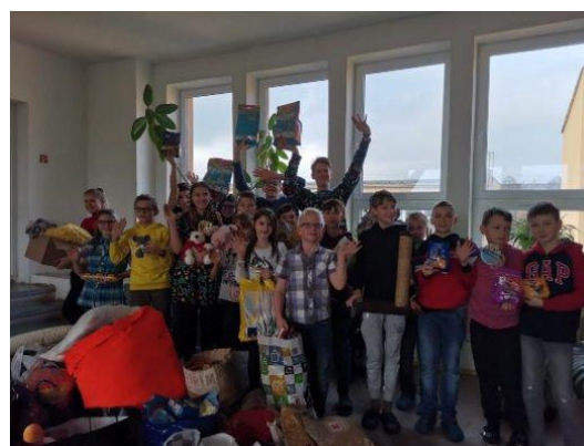
Dary pro útulky

zpráva naopak je, že řada stávajících obyvatel našla svůj nový domov, což je pro nás úplně to nejdůležitější. O všech adoptovaných kočičkách se můžete dozvědět na stránce http://www.mikeshb.cz/ .“