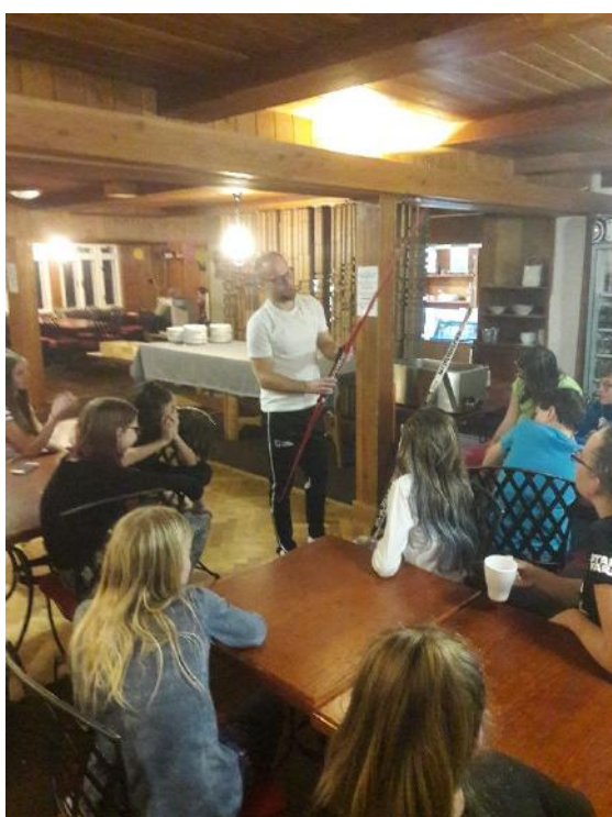
Přednáška o běžkách

Letos od 19. 1. do 26. 1. proběhl lyžařský kurz pro 7. až 9. ročník. Jako instruktoři s námi jeli paní učitelka Klubalová, pan učitel Pařil a pan učitel Charouzek. Rozdělili jsme se na 3 družstva. Žáci, kteří na lyžích ještě nestáli a teprve se učili, lyžovali ve 3. družstvě. Do 2. družstva byli zařazeni žáci již pokročilejší. A v 1. družstvu byli žáci lyžařsky nejzdatnější. Lyžovat se chodilo vždy dopoledne od devíti do dvanácti hodin a odpoledne od dvou do čtyř hodin. Celý lyžařský kurz se odehrával