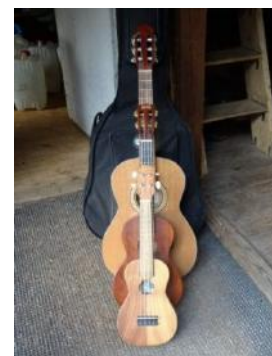
Hudba nesmí chybět

kroužek, ve kterém se budete učit vázat uzle venku v sadu, se toho moc říci nedá. Každá družina to totiž má jinak, některé se více zaměřují na učení a jiné zase na hraní her. Skaut každoročně pořádá i dva tábory, týdenní pro mladší a pro starší dvou až třítýdenní. A nejen to, každý rok se pořádá několik výprav. Ve výsledku je skaut plný dobrodružství, spousty her, přiučení se nemálo užitečných věcí, ale především tu jde o kamarádství.