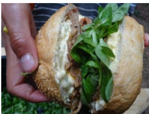
Na táborech je opravdu dobré jídlo

Skaut byl založen roku 1907 britským vysloužilým vojenským generálem Robertem Badenem Powellem, jakožto způsob jak naučit mládež disciplíně a více je spřáhnout s přírodou. První skautský tábor se uskutečnil hned roku 1907. V Čechách byl skaut založen později, až roku 1911, Antonínem Benjaminem Svojsíkem. Avšak organizace se u nás nejmenovala Skaut, nýbrž Junák, celým názvem Junák český skaut. Už bylo dost dějepisu, teď něco o Junáku dnes. Spousty měst má nějaká junácká střediska, větší města jich mají více, menší méně. Konkrétně Pelhřimov