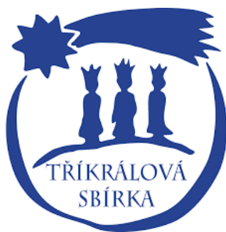
Logo tříkrálové sbírky

Každý už jistě slyšel o třech králich. Zmínka o nich, respektive o mudrcích z východu je v Bibli. Přišli se poklonit nově narozenému Ježíškovi do Betléma.