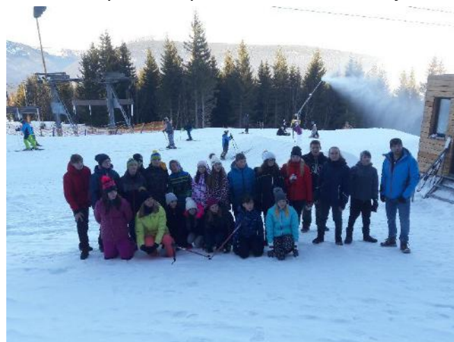
Všichni účastníci na procházce

na snowbladech pro 10 osob. Bylo však uskutečněno jen pro 7 žáků, poněvadž se troje snowbladey nenašly. Večerní zábavu zajišťoval