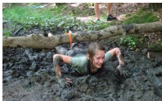
Ale není to pro žádné slečinky

si na začátku roku vymyslí své jméno a pokřik. Co se týče stereotypu, že skauting je nudný