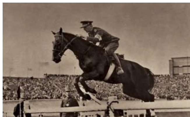
František Ventura a Eliot v Amsterdamu