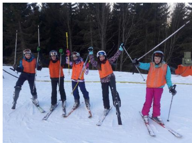
2. skupina na svahu

v Peci pod Sněžkou. Střechu nad hlavou zajišťoval hotel Žižkova bouda. První družstvo mělo možnost jet jeden den k nedalekým sjezdovkám jménem Jánské Lázně. V plánu bylo i čtvrtěční běžkování, ale neuskutečnilo se, protože sníh byl příliš namrzlý. A také bylo připraveno lyžování