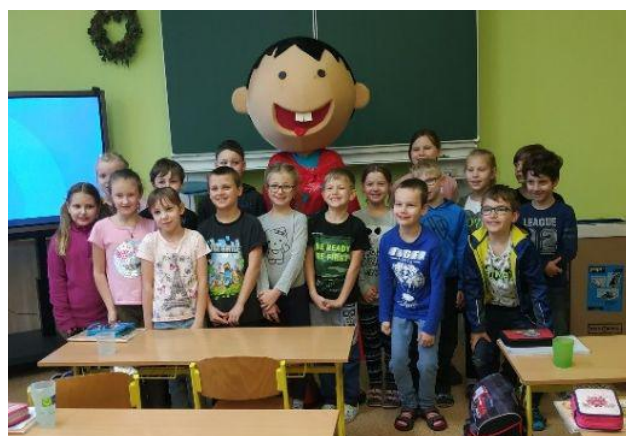
Bovýsek s dětmi

Víte, že Bovýsek nám každý týden přiváží čerstvé ovoce? A dne 17. 1. naši školu dokonce navštívil. Ve třídách poté ověřoval znalosti dětí o ovoci a zelenině. Ptal se jich, co se vyrábí z různého ovoce, nebo jestli ho poznají podle tvaru, či určité části. Děti byly moc šikovné a občasnou spoluprací vše uhodly. Na Bovýskovi bylo vidět, že má radost. Přichystal si pro ně odměnu v podobě pexesa s anglickými a českými názvy ovoce a zeleniny. Nakonec se s ním i jedna třída na památku vyfotila. Děti si návštěvu moc užily a těší se na příště.