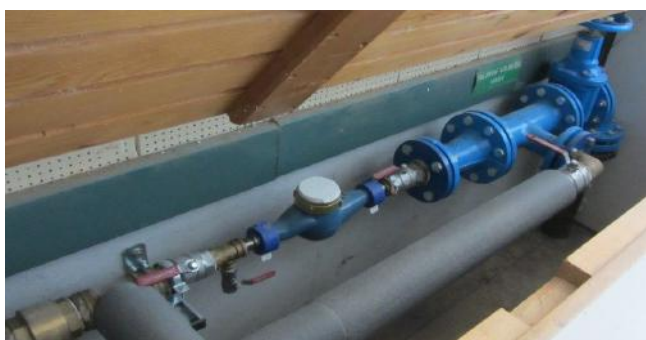
Nový hlavní uzávěr vody