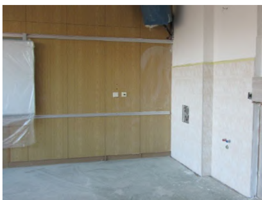
Nové obkladačky v 5. B